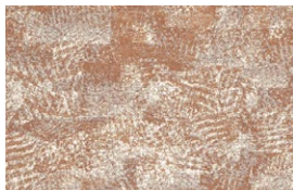
OLIO Sand Stone