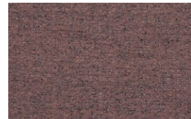
HAZE Smoked Lila