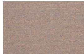
HAZE Pastel Ginger