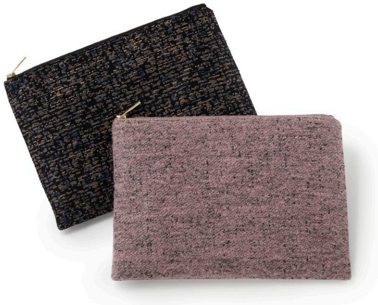
左:スクエアポーチミディアム 「GLARE Night Sky」 右:スクエアポーチミディアム 「HAZE Smoked Lila」 ともに29,700円(税込)