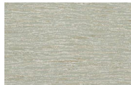
FIZZ Foggy Mist