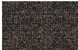
GLARE Night Sky