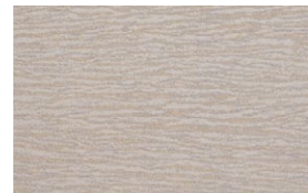
FIZZ Silver Grey