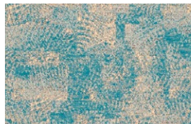
OLIO Vivid Ocean